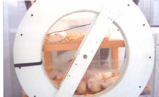
Şekil 1. Çalışmanın gerçekleştirildiği düzenek.

1,5 mT şiddetindeki ve 50 Hz frekanslı EMF uygulandı. Dışardan gelebilecek EMF etkileşimlerini engellemek için düzenek Faraday kafesi içerisine yerleştirildi, manyetik alan gruplara engelsiz ulaşsın diye çapları; 43cm x 42cm x 15cm olan flexiglas kafesler kullanıldı. Çalışmada ratlara uygulanan ELF MF iç çapları 25 cm olan ve aralarında 30 cm'lik bir mesafe bulunan düzey olarak bir Faraday kafesi içine yerleştirilmiş ve sarım sayısı 250 olan bir çift Helmholtz bobininden elde edildi. Faraday kafesi içinde iki özdeş Helmholtz deney düzeneği olup, bu bobinlere aynı miktarda (48 V, 40 amp.) voltaj ve akım üreten iki özdeş A.C güç kaynağı bağlanmıştır (Şekil 1). Ratların manyetik alan uygulaması boyunca kondukları flexiglas kafeslerin içindeki 15 farklı noktada manyetik alan ölçümleri dijital teslametre ile düzenli olarak yapılmıştır (Digital Gauss / Teslameter 7030 Hall Effect Gaussmeter, F.W.BELL, SYPRUS, Orlando, Florida, USA). Flexiglas kafes içinde bulunan ratlar serbest bir şekilde hareket edebiliyorlardı. Kontrol grubundaki ratlara ise herhangi bir uygulama yapılmadı. Ratlar, 22±3°C sabit sıcaklıkta, normal pellet yem ve çeşme suyu ile beslenerek, barındırıldı.